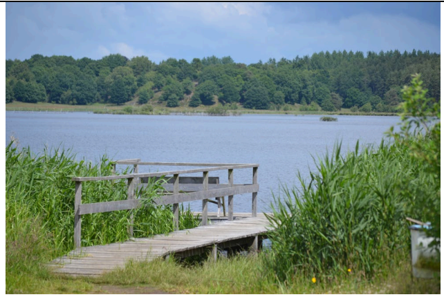
Broen ved Ellevej