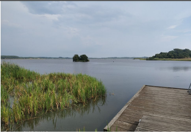
Broen ved Kragelundvej