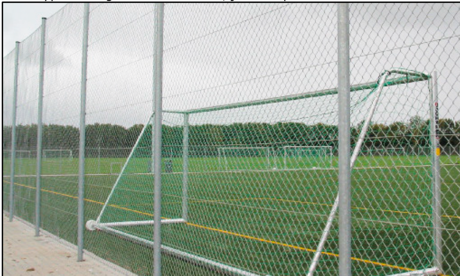
IDH 10 – 4 meter højt.

De to typer af hegn er vist nedenfor, jævnfør produktblade: