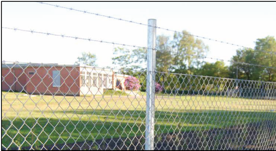
FVH 50 & 60 – to meter højt.